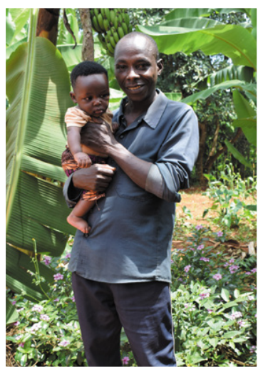
Abraham is inmiddels een trotse vader

“Kinderen opvoeden is voor vrouwen én voor mannen!”